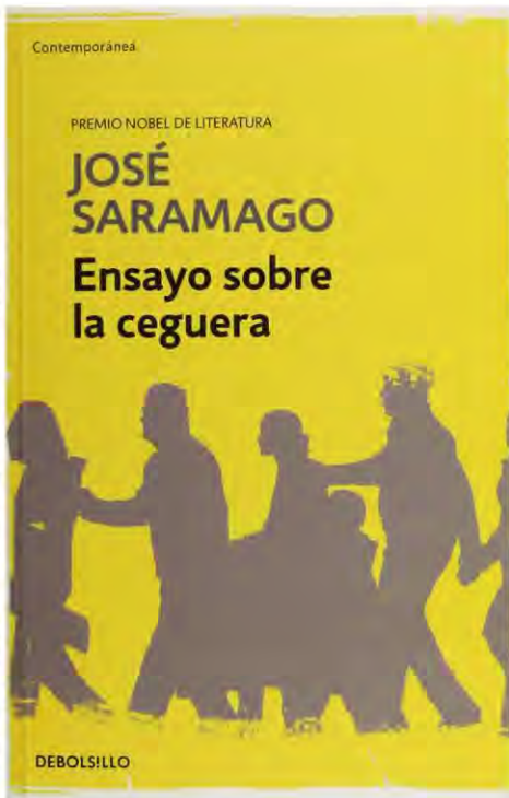
FOTO: Portada Libro Ensayo Sobre la Ceguera.