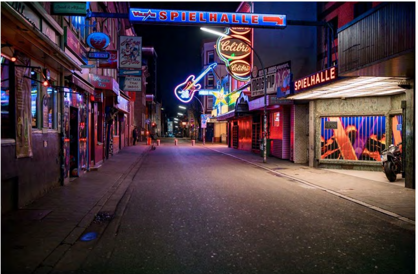
Una de las calles más famosas y visitadas a nivel mundial "die große Freiheit", en la fotografía se puede ver los clubes, bares y teatros cerrados y sin ninguna persona.