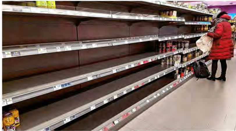
Área de conservas en un supermercado en Konstanz, Alemania casi vacío.

Sin embargo, no significa que el gobierno deba quedarse de brazos cruzados, definitivamente la suspensión de actos masivos, clases en las escuelas, conciertos,