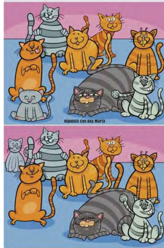
FOTO: 6 diferencias.

No les platico el final porque este fue un ejercicio de encontrar las diferencias y aunque las diferencias evocadas puedan aparentar ser más coincidencias, les digo que no podrían serlo porque unas pasan en un universo literario y otras tantas en la vida real. Ya le corresponderá al lector definir cuál será cuál.