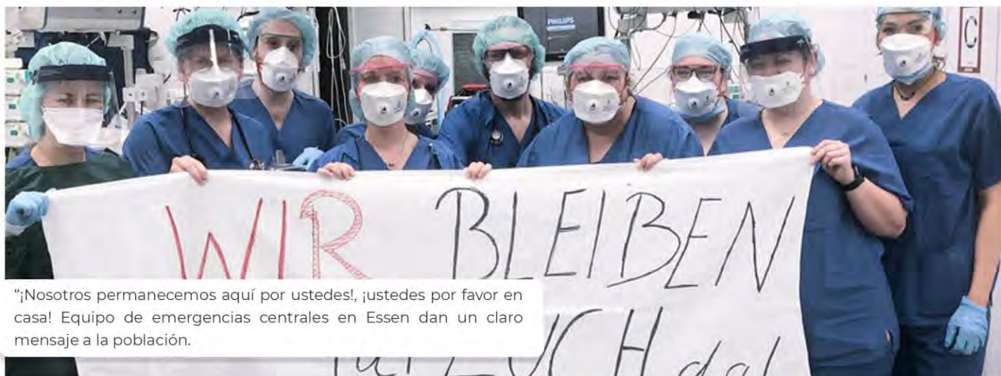
"¡Nosotros permanecemos aquí por ustedes!, ¡ustedes por favor en casa! Equipo de emergencias centrales en Essen dan un claro mensaje a la población.

En cierta forma es conmovedor entrar a grupos de Facebook donde personas ofrecen hacer tus compras o incluso cuidar a tus hijos si estas en estado de riesgo, personas con experiencia en hospitales siendo voluntarios y otras donando sangre, los trenes, estaciones y casi toda la ciudad están prácticamente vacías porque la mayoría decide tomar con conciencia y seriedad esta pandemia sin precedente.