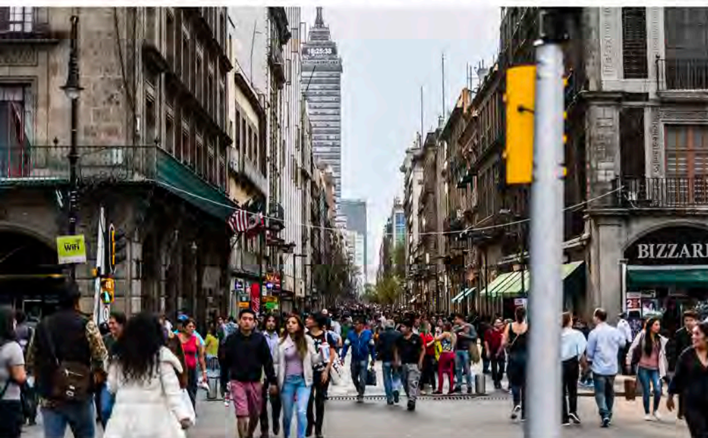
FOTO: Calle Madero

Ante este panorama, a nivel internacional también se ha