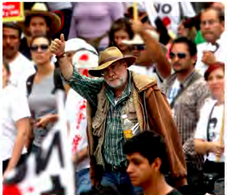
Marcha Javier Sicilia

Ante la realidad que es posible observar, se precisa insistir en el análisis, en la crítica, en la expresión de ésta, en la denuncia, en la propuesta, en la acción ciudadana organizada por la solidaridad, el respeto a la dignidad humana y la búsqueda del bien común.