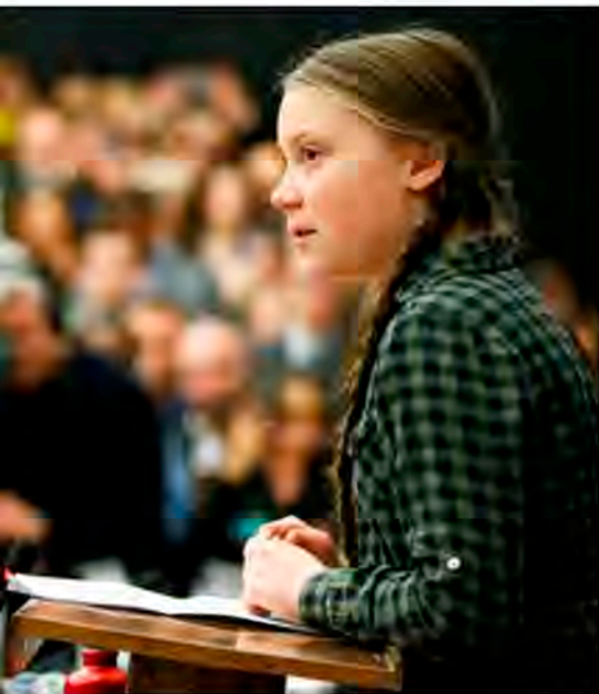
Greta Thunberg.

tuales no tienen tiempo de asimilar las mutaciones de su realidad cuando ya hay otras tocando la puerta.